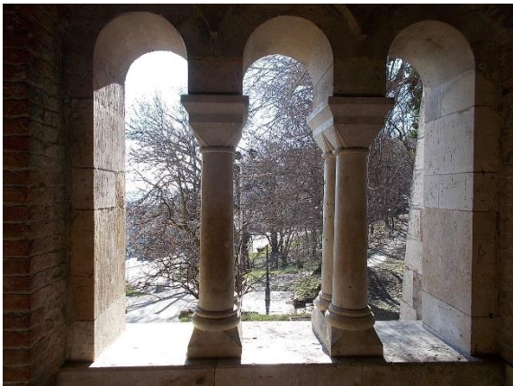
fotó: Hármas ablak belülről, Halászbástya, 2016 Budapest

A bennünket körülvevő médiakörnyezet nagyon sok képet tár elénk. Korábban a televízió szerepét az ablak metaforájával írták le. Azaz a televízió egy ablak, amely közel hozza, megmutatja a világot. Ez a metafora azt érzékeltette, hogy a világra való rálátással tudásunk tágul. Ez a megközelítés persze nagyon szűk, nem érzékelteti, hogy a különböző tartalmak, különböző funkciókba ágyazódnak: például a tehetségkutató versenyekre, a teleregényekre, a sorozatokra nem kinézünk, hanem sokak számára olyan élmény, amely „bejön a lakásba”, átélhető mindennapi élménnyé válik. Az ablak-kép azonban ma is alkalmas arra, hogy átgondoljuk, miképp működik az okostelefonok képernyője.